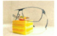
Kuchen- und Brillenparty.